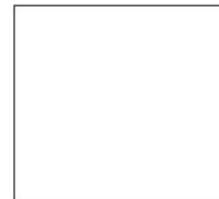
AZUL DEL REY