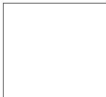
BRANCO NEVE ACETINADO